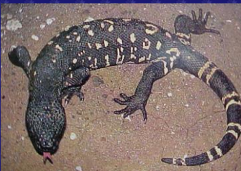
Heloderma horridum (Escorpión, niño dormido)