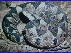
Athropoides nummifer (Mano de piedra)