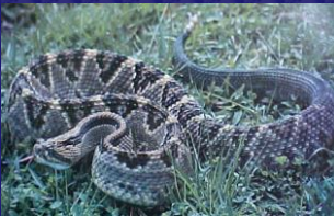
Crotalus durissus (Serpiente cascabel)