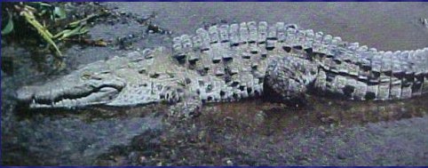
Crocodylus acutus (Cocodrilo americano)