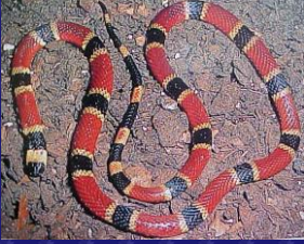
Micrurus nigrocinctus (Coral)