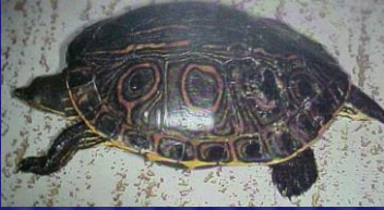
Trachemys scripta (Tortuga de río, tortuga de orejas rojas)