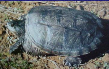
Chelydra serpentina (Sambundango, cruceyuche, tortuga mordedora)