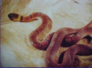
Ninia sebae (Madre de coral)