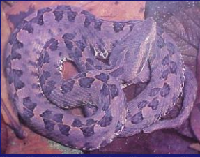
Porthidium ophryomegas ( Víbora castellana )