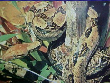
Boa constrictor (Mazacuata)