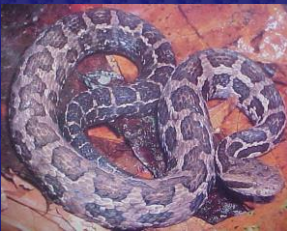
Cerrophidion godmani (Cheta, cantil de tierra fría)