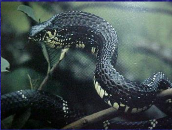
Spillotes pullatus (Chichicúa)