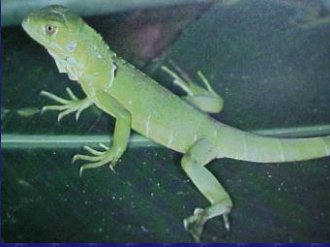
Iguana iguana (Iguana verde)