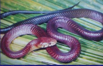
Drymarchon corais (Zumbadora)