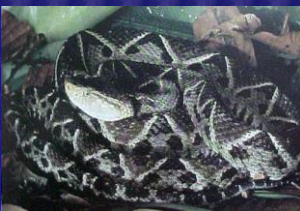
Bothrops asper (Barba amarilla, terciopelo)