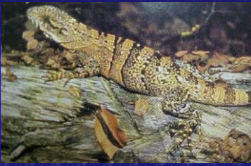
Ctenosaura similis (Iguana jiota, geshpo)