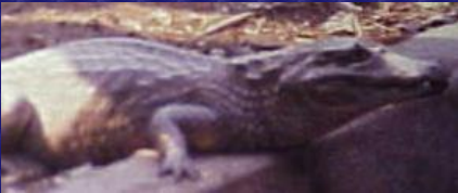
Caiman crocodilus (Caimán)