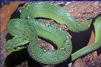
Botriechis aurifer ( Gushnayera )