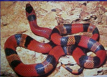
Lampropeltis triangulum (Falso coral)