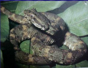
Bothriechis schlegelii (Víbora de pestañas)