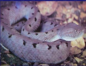
Porthidium nasutum ( Víbora chata )