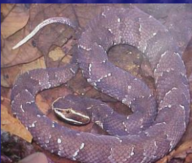
Agkistrodon bilineatus (Cantil)