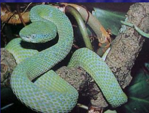
Botriechis bicolor ( Víbora de palma )