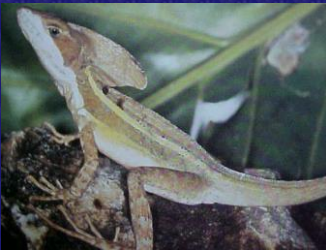
Basiliscus vittatus (Cutete)