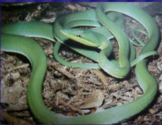
Oxybelis fulgidus (Bejuquillo)