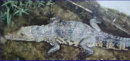
Crocodylus moreletii (Cocodrilo de Petén)