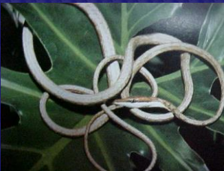
Oxybelis aeneus (Bejuquillo)