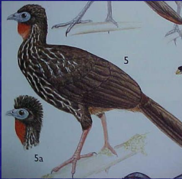
Penelope purpurascens (Cojolita)