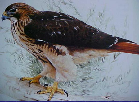
Buteo jamaicensis (Halcón cola roja)