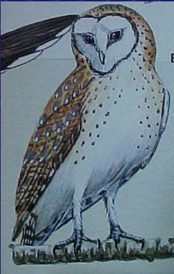
Tyto alba (Lechuza de granero)