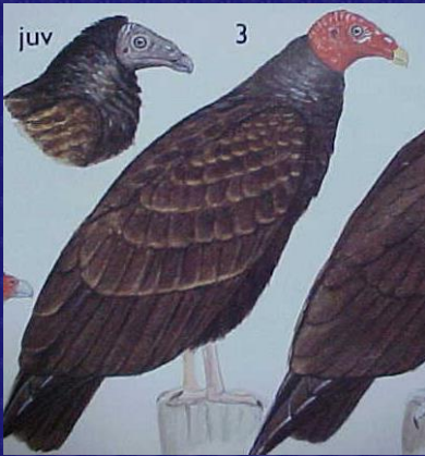
Cathartes aura (Aura común)