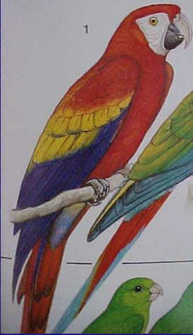
Ara macao (Guacamaya roja)