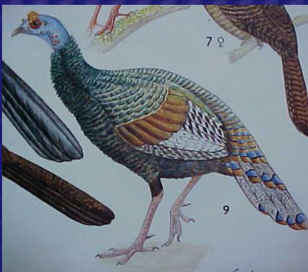
Agriocharis ocellata (Pavo ocelado, pavo de Petén)