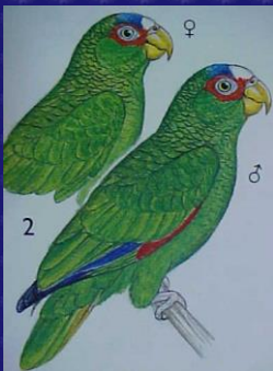
Amazona albifrons (Loro frente blanca)