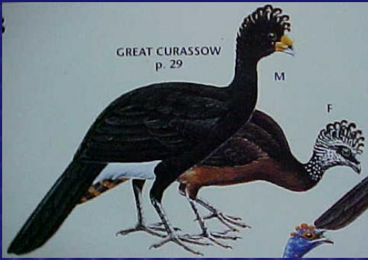
Crax rubra (Pajuil, faisán)