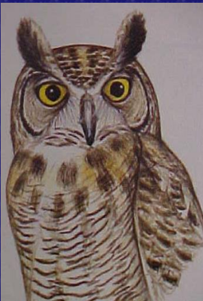
Bubo virginianus (Buho cornudo grande)