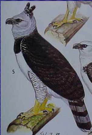
Arapia arpija (Águila arpía)