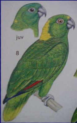
Amazona auropalliata (Loro nuca amarilla)