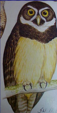
Pulsatrix perspicillata (Buho de anteojos)