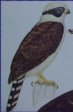
Herpetotheres cachinnans (Guaco)