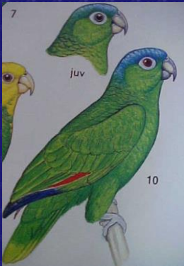
Amazona farinosa (Loro cabeza azul, loro real)