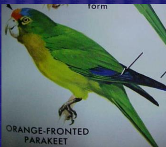
Aratinga canicularis (Perica guayabera)