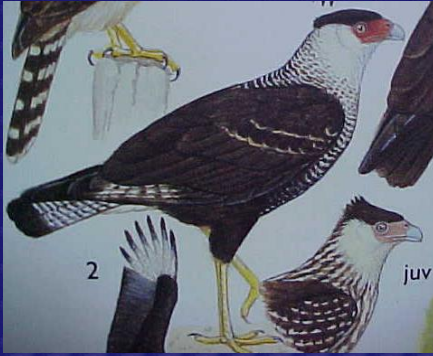
Caracara plancus (Quebrantahuesos)