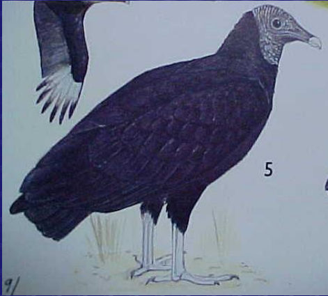
Coragyps atratus (Zopilote común)