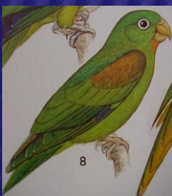
Brotogeris jugularis (Perica señorita, Catalina)