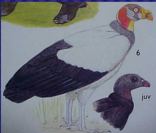
Sarcorampus papa (Zopilote rey)