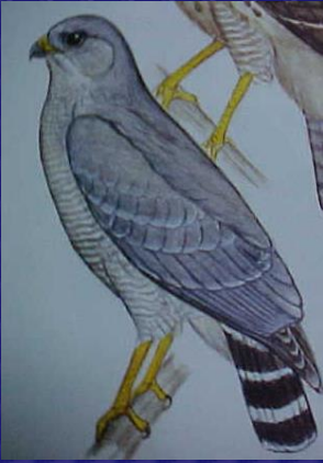
Asturina nitida (Gavilán gris)