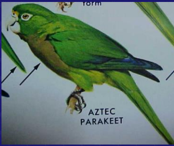
Aratinga astec (Perica azteca)