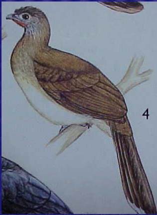
Ortalis leucogastra (Chacha de vientre blanco)