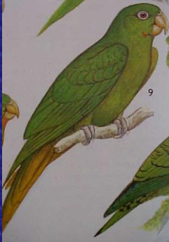
Aratinga holochlor (Perica chocoya)