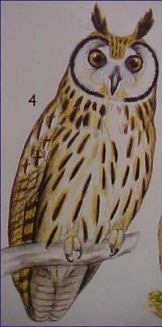
Asio clamator ( Pseudoscops clamator ) (Lechuza cariblanca)