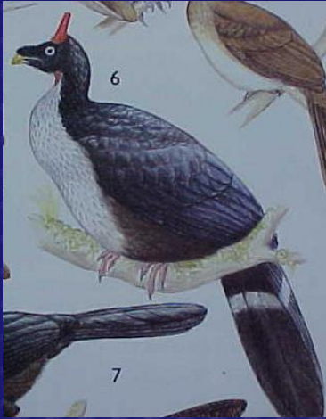
Oreophasis derbianus (Pavo de cacho)