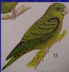
Bolborhynchus lineola Periquito listado