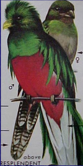
Pharomachrus mocinno (Quetzal)