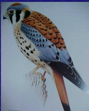
Falco sparverius (Clis clis, Cernícalo americano)