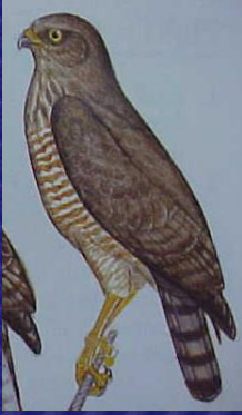
Buteo magnirostris (Gavilán del camino)