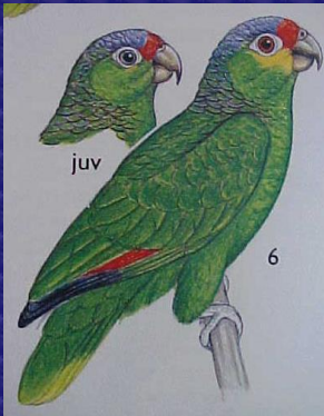
Amazona autumnalis (Loro frente roja, quenque)