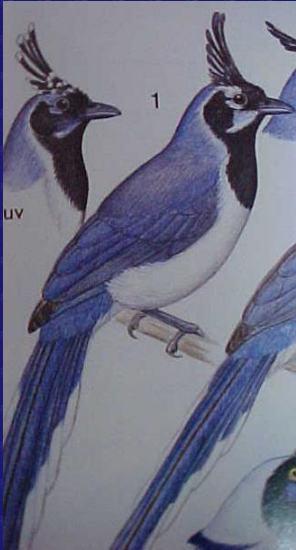
Calocitta formosa (Urraca)