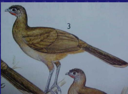
Ortalis vetula (Chachalaca común)