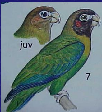
Pionopsitta haematotis (Cotorra de cabeza parda)