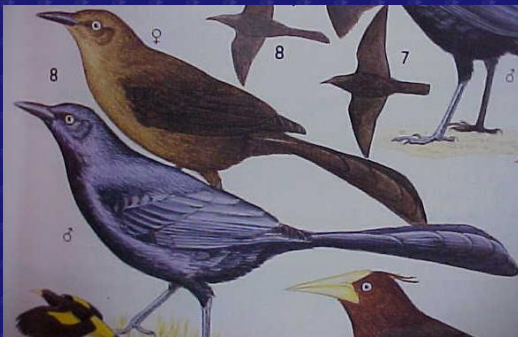
Quiscalus mexicanus (Zanate)