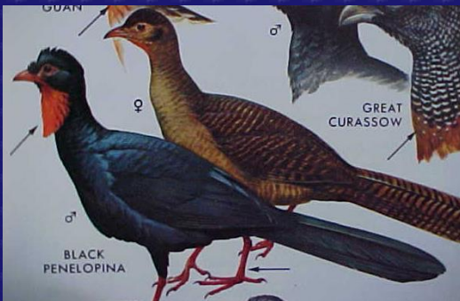
Penelopina nigra (Chachalaca negra)